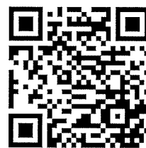
報名網址 QR CODE