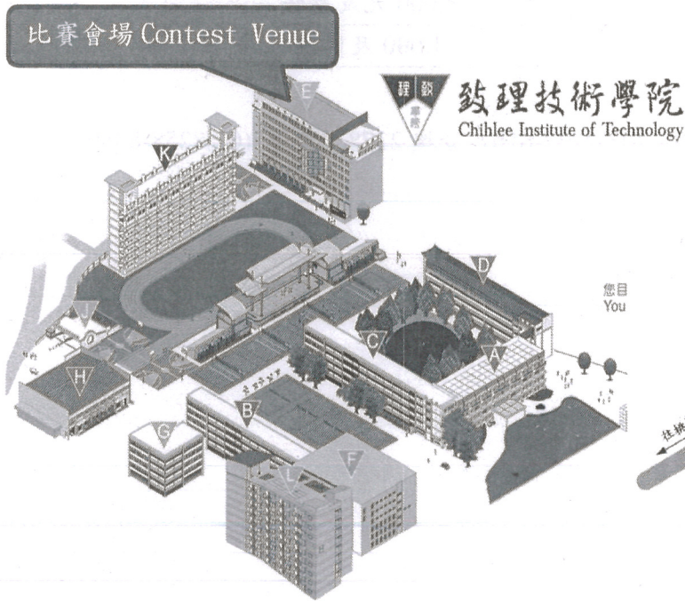
圖 1 校園導覽圖