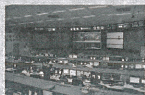
國際太空站管制中心