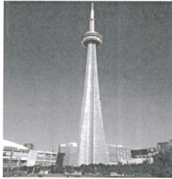
Fig. 2 View Tower: CN Tower in Toronto.