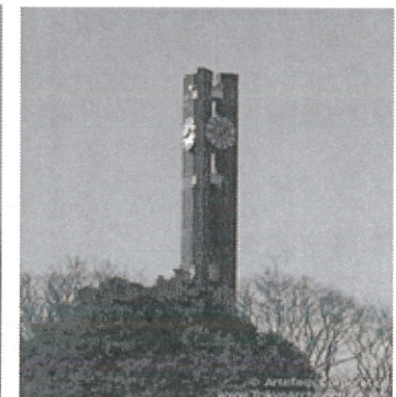
Fig. 6 Clock Tower in Tokyo.