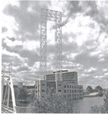
Fig. 1 Truss/Space Frame structure in Green Island Ottawa, Canada.