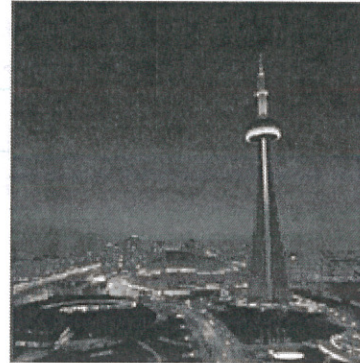
Fig. 3 View Tower: CN Tower in Toronto.