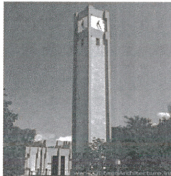
Fig. 5 Clock Tower: Northwestern University Rebecca Crown Center Clock Tower.