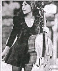
美國明尼蘇達大學音樂博士