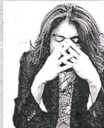
巴黎高等師範音樂學院吉他系