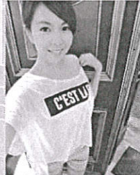
紐西蘭奧克蘭大學大眾傳播學