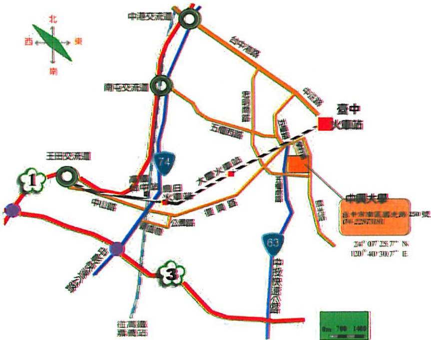
校區位置總配置圖