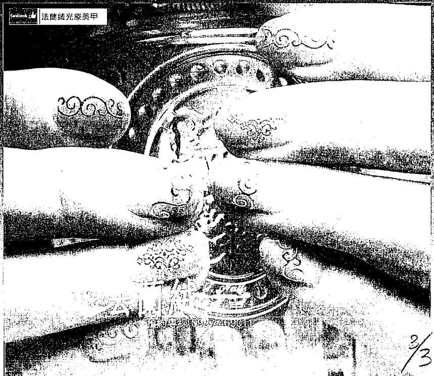
特殊光療夾心設計