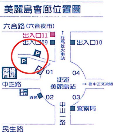
圖 2：美麗島會廊週遭停車場