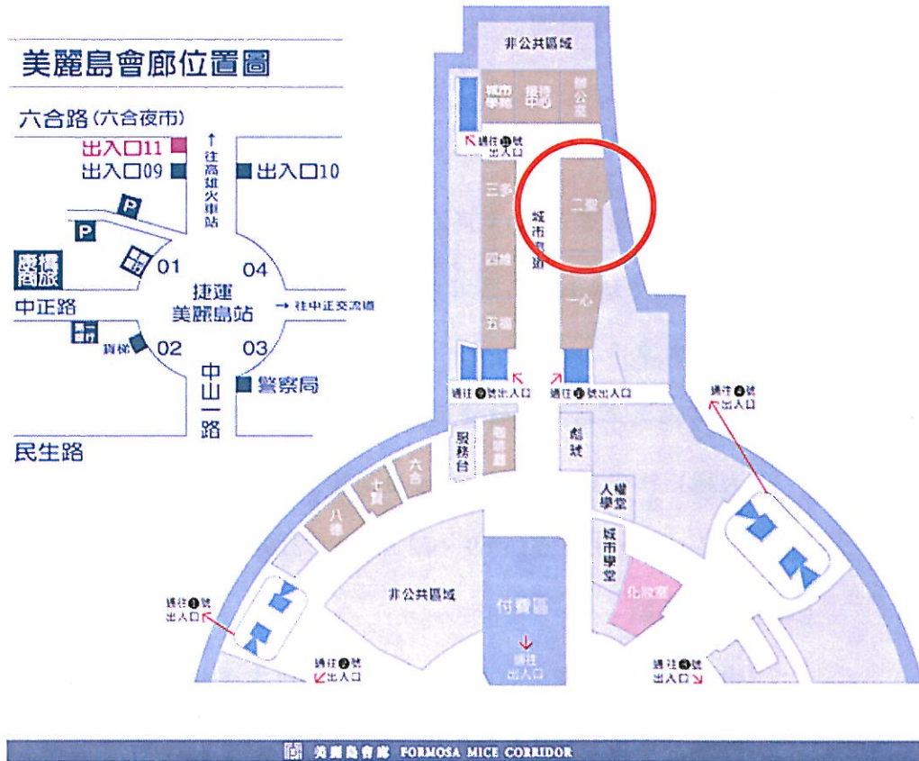
圖 1：美麗島會廊交通位置圖