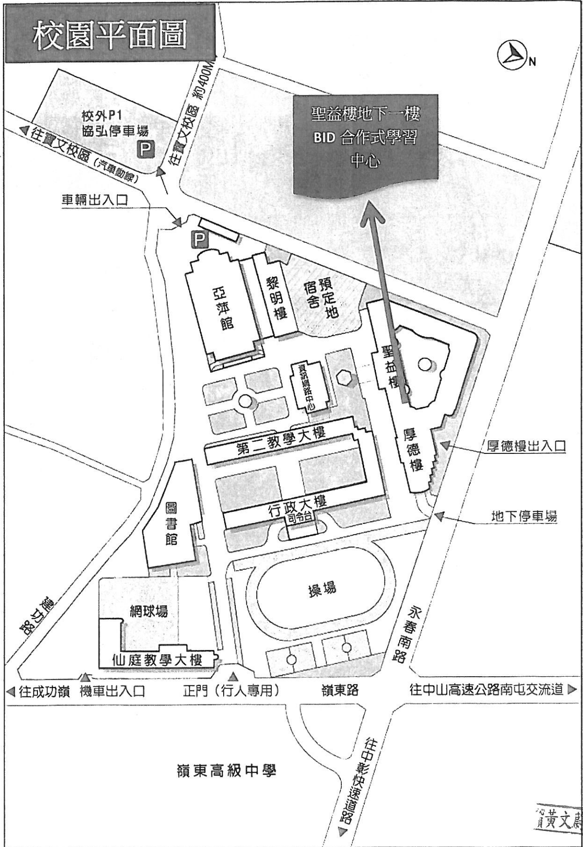
嶺東科技大學春安校區平面配置圖