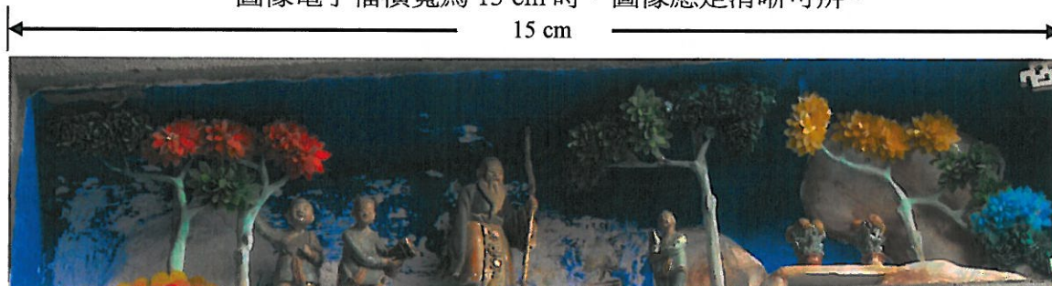
圖 1. 圖像說明文字請向左對齊，整段文字置中對齊於圖像下方。