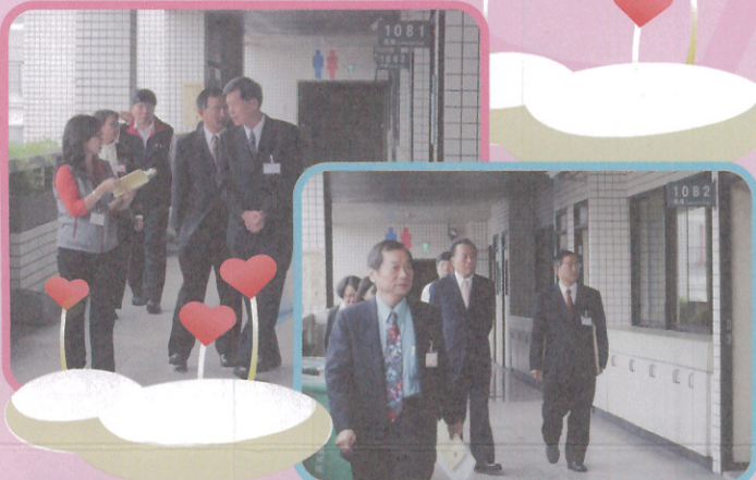
▲102年身心障礙人員特考黃典試委員長錦堂、余監試委員騰芳巡視臺北考區試務

(本刊訊) 102年公務人員特種考試身心障礙人員考試於4月27日至28日分別在臺北、臺中、高雄、宜蘭、花蓮及臺東等6考區同時舉行，並於4月28日下午圓滿結束。