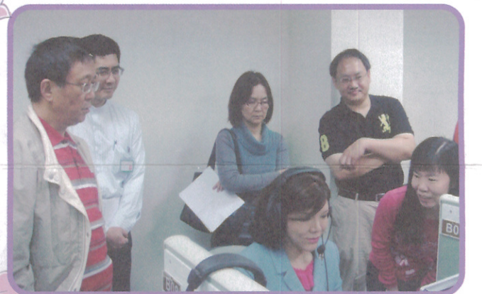
▲公務人員考試客家事務行政類科客語預試趙考試委員麗雲、董部長保城及曾常務次長慧敏等巡視考場，趙委員並親身體驗口說測驗考試方式

(本刊訊) 公務人員考試客家事務行政類科客語預試於4月20日在考選部國家考場舉行，應試科目為「實用客語與客家語文」一科(包括聽力及口說測驗)，預試結束後並就應考人進行問卷調查，於當日下午1時圓滿結束。預試期間趙考試委員麗雲、蔡考試