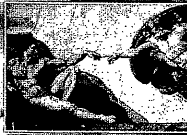
米開朗基羅 350 X 155 cm