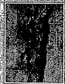
米開朗基羅 350 X 155 cm