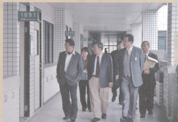
▲102年關務、稅務、海巡、移民、退除役特考及軍官轉任考試詹典試委員長中原、李監試委員復甸及考選部董部長保城巡視臺北考區試務

(本刊訊) 102年公務人員特種考試關務人員考試、102年公務人員特種考試稅務人員考試、102年公務人員特種考試海岸巡防人員考試、102年公務人員特種考試移民行政人員考試、102年特種考試退除役軍人轉任公務人員考試及102年國軍上校以上軍官轉任公務人員考試於3月30日至4月1日在臺北、臺中、臺南、高雄、花蓮、臺東等6考區同時舉行，並於4月1日上午圓滿結束。考試期間，詹典試委員長中原、李監試委員復甸、其他考區典試委員、監試委員及考選部董部長保城等均蒞臨考場巡視並對工作人員致