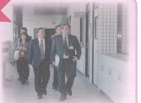
▲102年專技普考導遊、領隊人員考試考試院關院長中、歐典試委員育誠、高監試委員鳳仙、考選部董部長保城及嘉義市黃市長敏惠巡視嘉義考區試務

於3月17日下午16時30分圓滿結束。考試期間，考試院關院長中、蔡典試委員長式淵、杜監試委員善良、其他考區典試委員、監試委員及考選部董部長保城等均蒞臨考場巡視並對工作人員致慰勉之意。本次考試總計報考97,665人，經試務處統計，最後一節到考人數80,521人，到考率為82.45%。