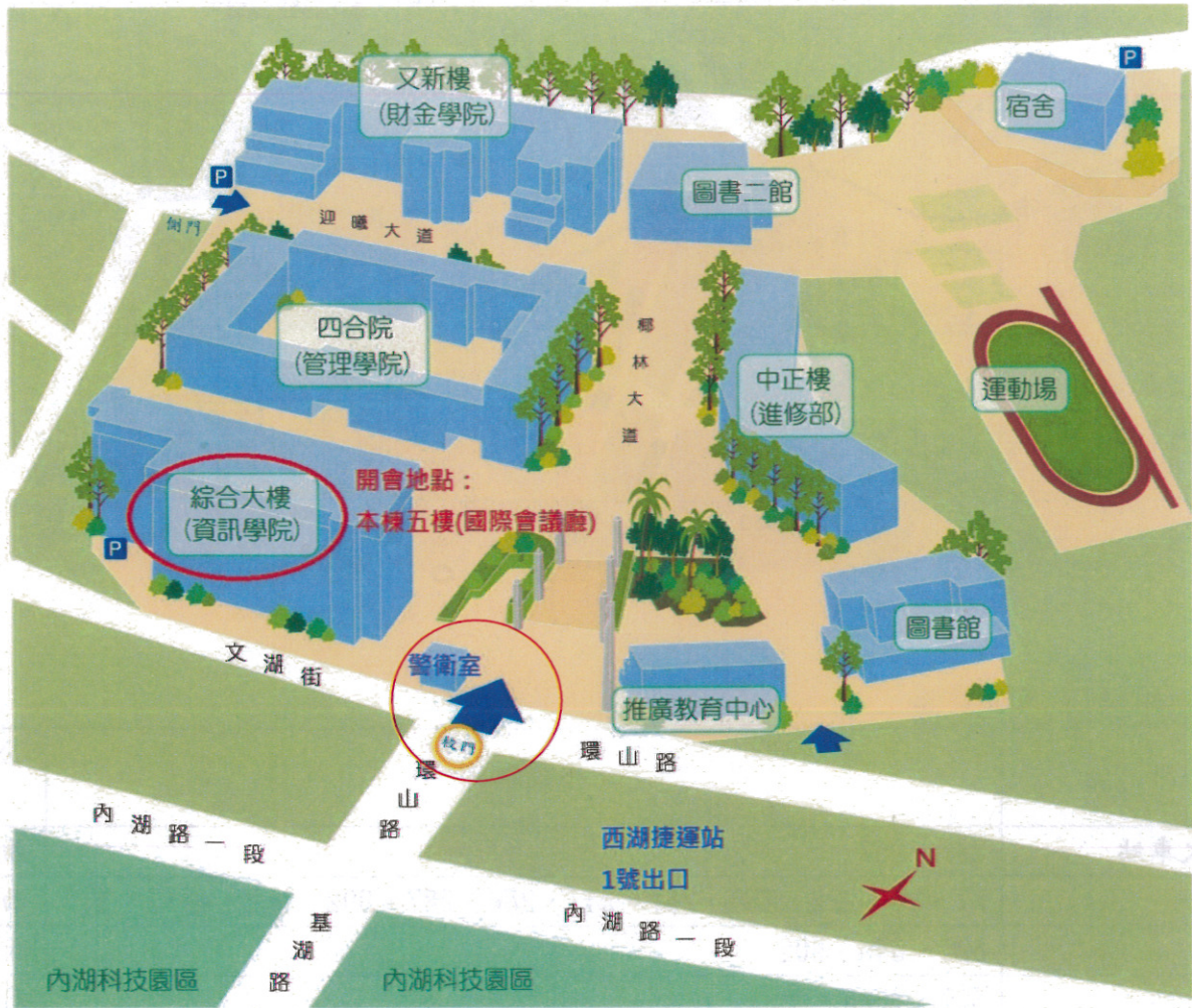
(德明財經科技大學綜合大樓 5 樓國際會議廳)