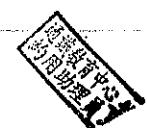
國立台東大學校區位置圖