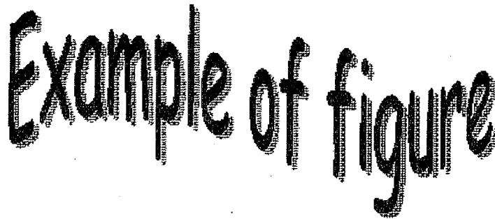
圖像 1 圖像實例

稿件可以含有圖像與表格。圖像檔案格式須為微軟™ Word 所支援。建議使用通用圖像檔案格式例如.gif 及.jpg。而表格則可以是任何在文字處理器內提供的款式。圖像及表格說明英文使用 Times New Roman、12 點、置中。日文使用 MS-Gothic、12 點、置中。圖像及表格須分開編號。將圖像說明置於圖像之下，將表格說明置於表格之上。請參考下列圖像 1 為例。