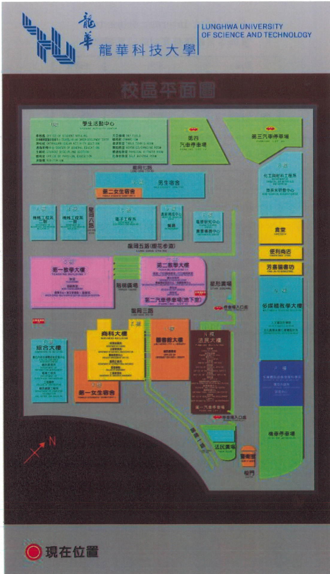
附件一：校園平面圖