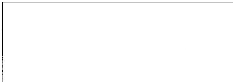
圖 1○○○(新細明體,12p,粗體)、線條( , 12p) (英文 Times News Roman,粗體)